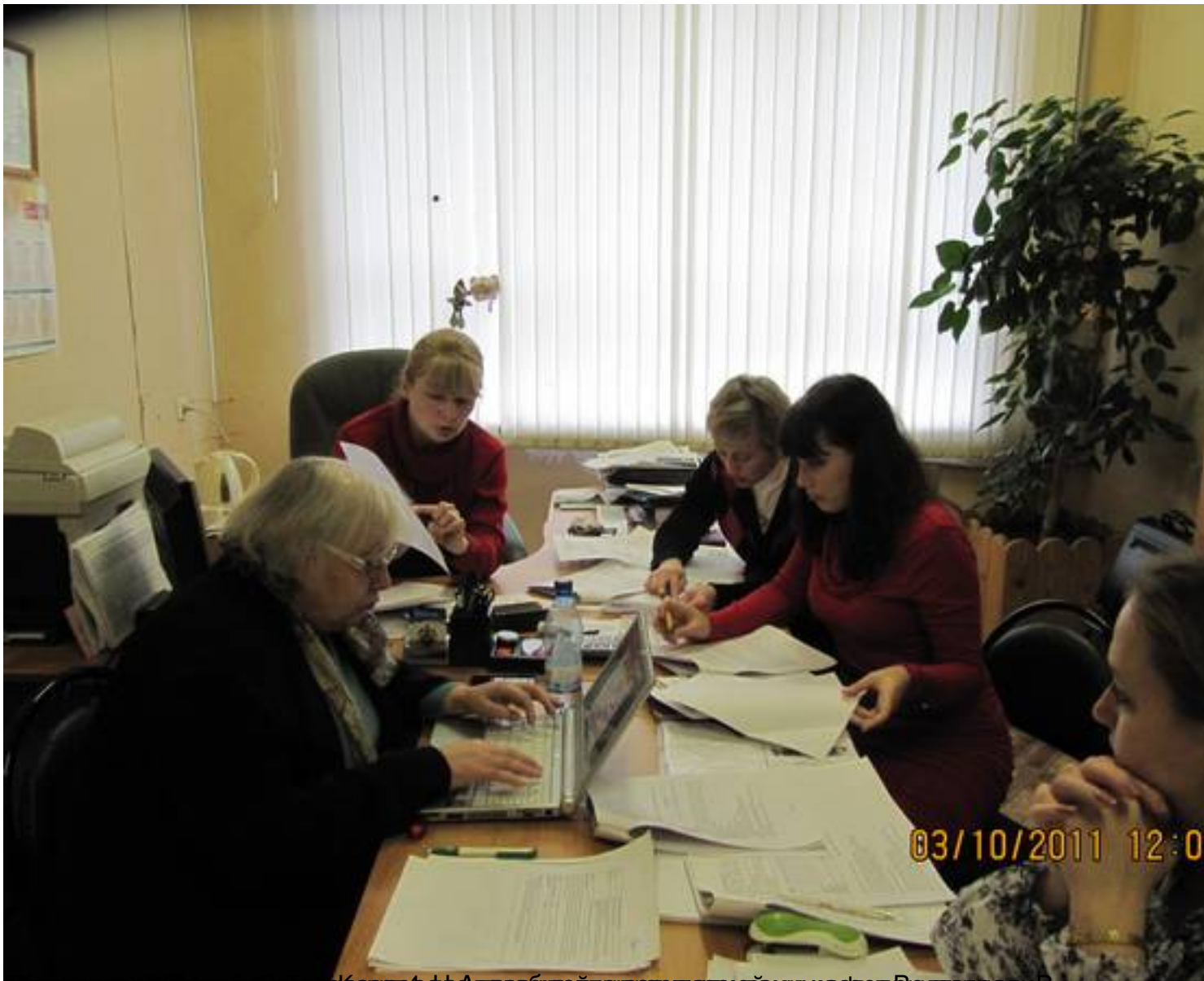
руководитель отдела кадров и специалист по работе с персоналом в отделе кадров в г. Волгоград