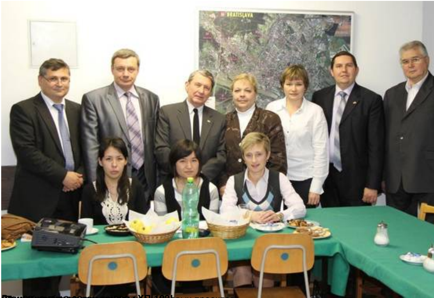
Встреча с представителями ХПК 1085 в рамках проекта «Местные власти»